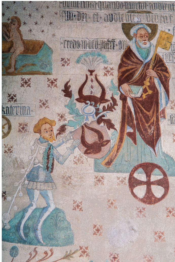
Figur 8. Stiftarbild i Tensta kyrka.

stycke och har sedan sammanfogats med det plana bakstycket. Insidan av hjälmen är svartmålad, liksom hjälmfönstren, för att ge intryck av djup och därmed också ge föremålet en ökad plasticitet.