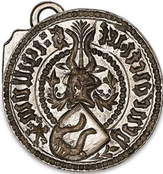
Figur 9. Bengt Jönssons (Oxenstierna) sigillstamp.