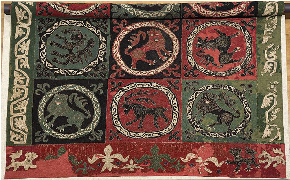
Figur 4. Guldskinnstäcke från Dalhem i Småland, nu i SHM.