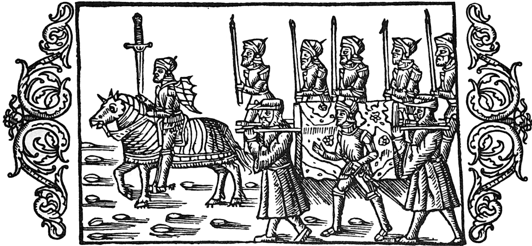
Figur 1. Träsnitt ur Olaus Magnus Historia om de nordiska folken som visar en senmedeltida begravningsprocession.

list och ondska och vid dödsögonblicket gällde det att kunna värja sig mot de ansatser som gjordes från djävulens sida för att försöka vinna den döendes själ. Minnet av den döde var viktigt att hugfästa och levde vidare i de donationer som gjorts till kyrkan, där det så gott som alltid ingick läsning av mässor vid ett specifikt altare. Detta kombinerades med materiella donationer som muralmålningar, textilier, vaxljus, liturgiska kärl och andra föremål. Ett av de sista tillfällena där den dödes betydelse som civil person kunde manifesteras var begravningen, där den dödes börd och betydelse främst kom till uttryck genom begravningsprocessionen. Olaus Magnus (1490–1557) beskriver i sin Historia om de nordiska folken ( Historia de gentibus septentrionalibus ) hur det gick till när en riddare begravdes: