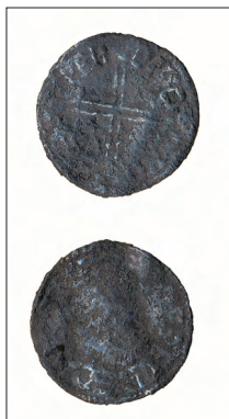
Mynt fnr 1544 (skala 1:1)