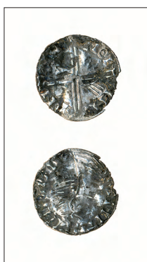
Mynt fnr 1549 (skala 1:1)

Mynten kunde inte ge någon närmare datering av de kontexter som de påträffades i. Trots detta har de använts i diskussionen kring främst bebyggelsens ramdatering eftersom det troligaste är att mynten ursprungligen låg i bebyggelsekontexter. Enligt mynttabellen ovan täcker myntens präglingstider perioden 963–ca 1050. Med tanke på myntens cirkulationstider har det föreslagits att bebyggelsen etablerades kring 1000-talets början och att kyrkogården är anlagd efter ca 1050 (Tesch & Jonsson 2006:9). Möjligheterna att påträffa mynt som är yngre än ca 1055 är mycket små eftersom myntimporten därefter minskade kraftigt (ibid). Efter att artikeln i Myntstudier skrevs har en mer detaljerad stratigrafisk bearbetning av materialet gjorts. Det har visat sig att den äldsta fasen (fas 1a) var mycket diffus med spridda kulturlager och bebyggelse, vilket sannolikt innebar färre möjligheter att påträffa mynt från dessa lager. Bebyggelsen i denna fas kan