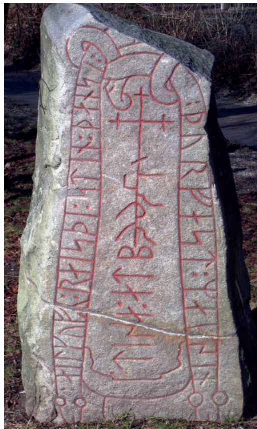
Fig. 1. Lingastenen Sö 352 finns på Skansen i Stockholm. Scenen med oxhuvudet är dold under markytan.

Ungefär där stod vi år 2012, då under-teknad argumenterade för att Dybeck hade rätt i sin retoriska fråga om ”farkosten med det nedhängande hufvudet”. Det är kontexten av kristen missionsstrategi med meningsbärande ikonografi, samt social status och tillhörande materiell kultur som gör det högst sannolikt att vi ser Tors fiskafänge och inte ett skepp som ligger för ankar. Lingastenen restes vid den stora allfarvägen längs Sörmlandskusten, och där vägen passerade över Linga hed låg ett stort gravfält med bland annat en imponerande skeppsättning och tre storthögar i rad. Praktfulla fynd av svärd och silver, samt begravningar i båtar pekar på hög social hemvist för de höglagda. I den här miljön förväntar man sig dyrbara järnankare – i likhet med Ladby och Oseberg (Edberg 2011). Att man då skulle ha valt att rista ett enkelt ankare av ihopsurrade träbitar kring en klumpsten är socialt omöjligt. Simpla stenankare hör hemma hos fattiga skärgårdsfiskare. Att avbilda ett järnankare är inte svårt, men det