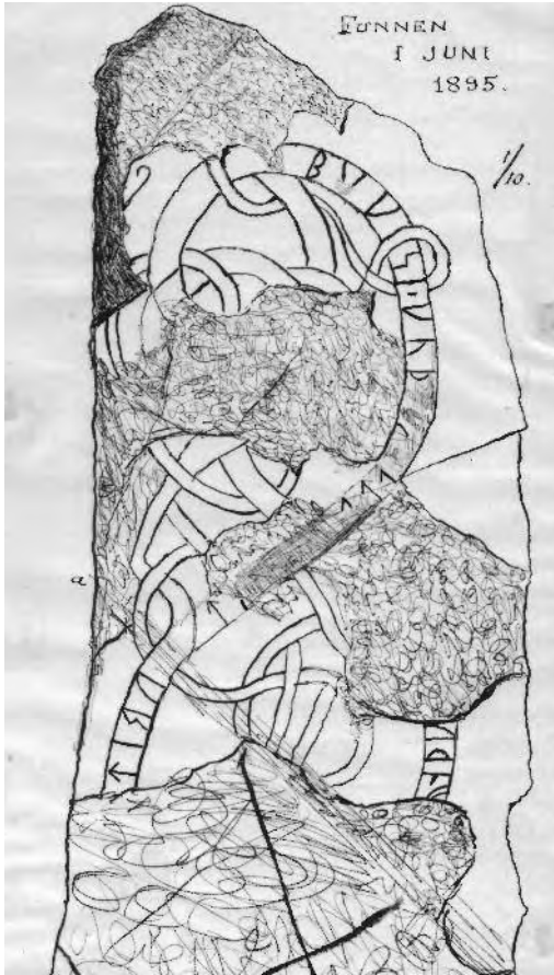
Fig. 3. Oscar Almgrens avteckning av runstenen U442 i samband med fyndet 1895. Efter original i ATA. Bilden beskuren nedtill.

ven i en m -runa. I runföljden alū är den första runan felläst i Upplands runinskrifter. Den bör definitivt vara n och inte a och de följande två runorna kan också utgöra resterna av tr . Efter ett skadat parti läser sedan Almgren ...-tu , där åtminstone bistaven till den sista runan fortfarande går att iakttä på stenen. Detta måste vara slutet av ett hjälperb [lē]tu "lät" vilket visar att de följande runorna rit... har tillhört huvud verbet rēttā "uppressa". Tack vare Almgrens iakttagelser