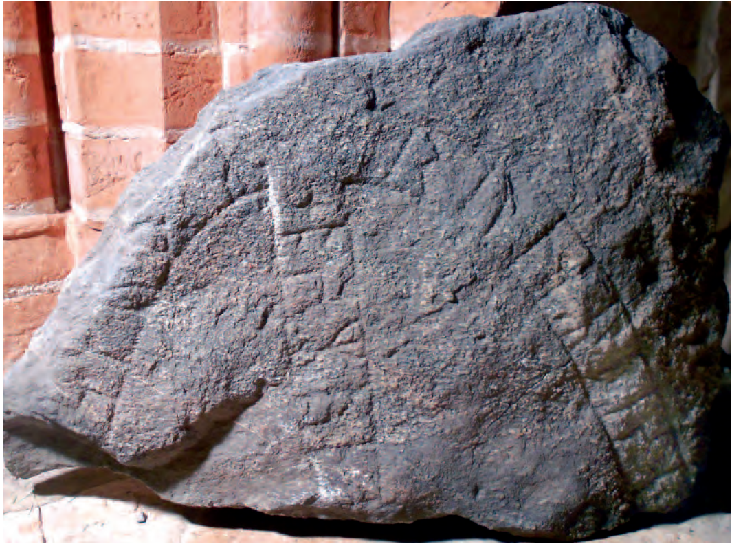
Fig. 1. Den nyfunna runstenen fotograferad med släpljus i kyrkans vapenhus. 2013.

de märke till att stenen var ristad. Lars Andersson vid Stockholms läns museum, som var antikvarisk kontrollant för muromläggningen, blev omedelbart underrättad och kunde göra en första besiktning av fyndet. Samma dag tog han kontakt med mig och redan dagen efter kunde vi tillsammans ta en närmare titt på stenen.