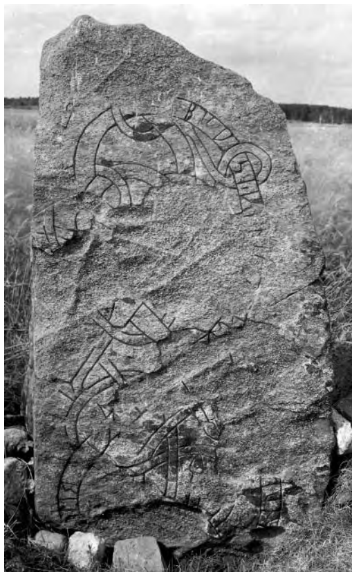
Fig. 2. Runstenen U 442 var svårt skadad redan när den påträffades 1895.

Märkligt nog refererar Wessén inte Almgrens undersökning från 1895, trots att denne har ritat av stenen och faktiskt också iakttagit en runa som senare blivit oläslig