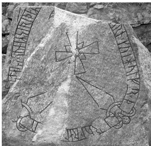
Fig. 5. Runstenen U 608, Västra Ryds kyrka. Rest av ”Sigrids söner”.

Metronymica, det vill säga just detta att barnens tillnamn bildas på moderns namn, förekommer i Skandinavien under vikingatiden. Det mest kända exemplet torde vara den danske kungen Sven Estridsen, vars far var Ulf Jarl och vars mor var Estrid, dotter till Sven Tveskägg. Eftersom hon var av kunglig börd fick sonen hennes namn. I isländska sagor förekommer flera exempel på metronymica, t. ex. i Egil Skallagrimsons saga och i Laxdalingarnas saga, ibland beroende på att fadern dött tidigt, men ibland trots att fadern levde och var väl känd (Kvaran 1996:38). Magnus Källström har nyligen behandlat fenomenet parentonymikon och han menar att det inte ska uppfattas som något vanligt utan tvärtom sällsynt och att det bör finnas en särskild anledning när ett tillnamn som innehåller faders- eller modersnamnet förekommer (Källström 2010: 118). Efter en genomgång av alla kända exempel är hans slutsats att sådana tillnamn är en tydlig statusmarkör, samtidigt som det vid omgiften kunde vara befogat att identifiera olika barnkullar, kanske av arvsrättsliga skäl (2010:130 ff.). I vårt område finns åtta exempel på parentonymikon, de flesta män som sägs vara en mans son, i ett fall uppges det ”... dessa var Vigulvs arvingar”. Kvinnorna representeras av Sigriddsönerna i Västra Ryd (U 608) och av Gillög, Ekenävs dotter i Knivsta (U 472). Man bör också notera flyttblocket U 392, Klockbacken i Sigtuna, ristat av Sven till minne av fyra