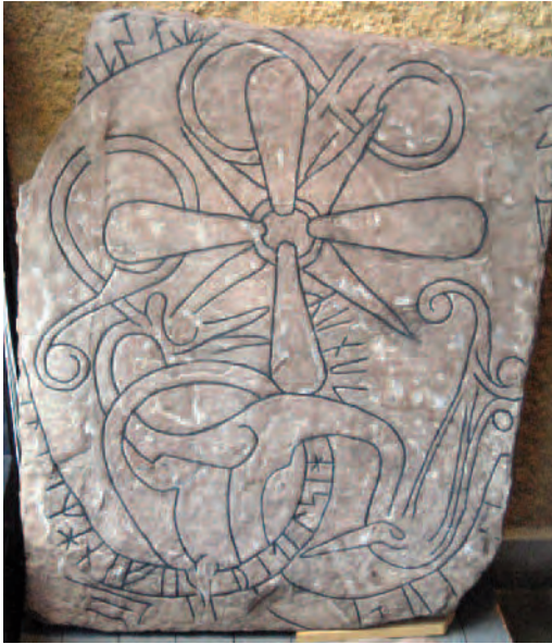
Fig. 6. Runstenen U 395, numera i Sigtuna Museum.

I detta sammanhang är det värt att notera att åtta fynd av så kallade sepulkralstenar, som torde ha ingått i portabla altaren (inpassats i en ram av trä), gjorts på olika platser i Sigtunas stadsmiljö, stratigrafiskt daterade till tiden mellan ca 1050 och 1200 (Tesch 2007:45 ff). Mittpartiet av U 395 har, genom borthuggningen av kanterna, blivit i det närmaste kvadratisk, om än betydligt större än det av Stolt uppgivna normalmåtet. Jag associerar här till den idé som har framförts av Carl-Fredrik Hallencreutz, nämligen att korsmärkta runstenar kunde fungera som gudstjänstplatser innan man hade tillgång till kyrkobyggnader (1991: 29). Kanske valde man att, som en akt av tradition och kontinuitet, använda mittpartiet av denna runsten i altaret i S:t Pers kyrka? Något liknande skulle man kunna tänka sig för runstenen U 978 i Gamla Uppsala kyrka, även den med ett dominerande centralt kors. Av uppteckningar från 1600-talet