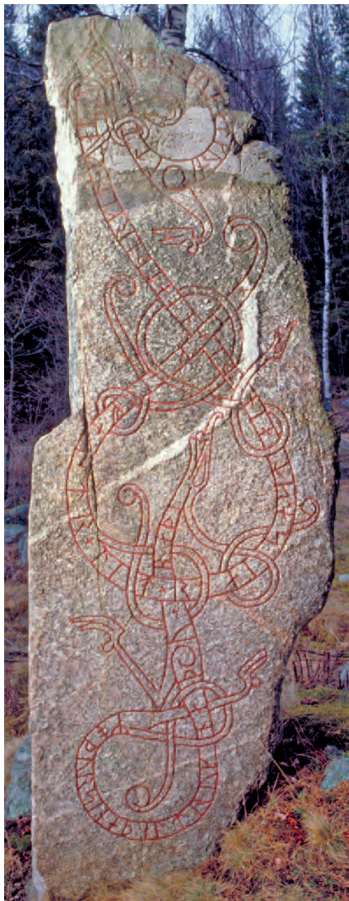
Fig. 7. Runstenen U 455, Näsby, Odensala, rest efter två drunknade föräldrar.