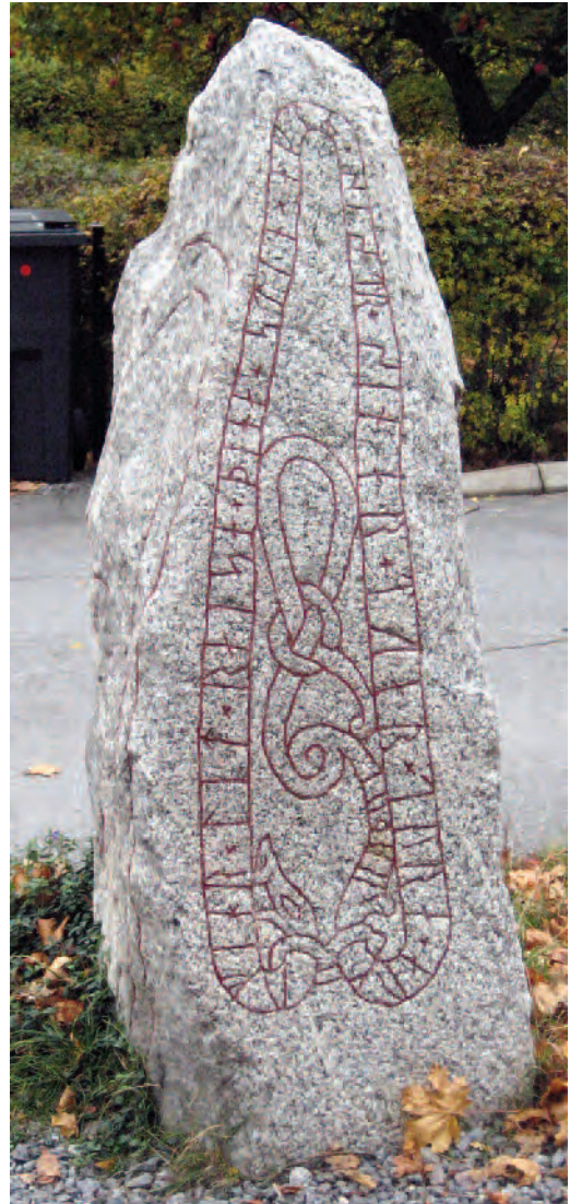
Fig. 1. Runstenen U 393 (A-sidan), Borgmästarvreten i Sigtuna. Rest efter systrarna Tora och Rodvi.

En spridd uppfattning är att runstenar restes av män till minne av män, och det stämmer att den vanligaste inskriften är att en son reser stenen till minne av sin far. Men