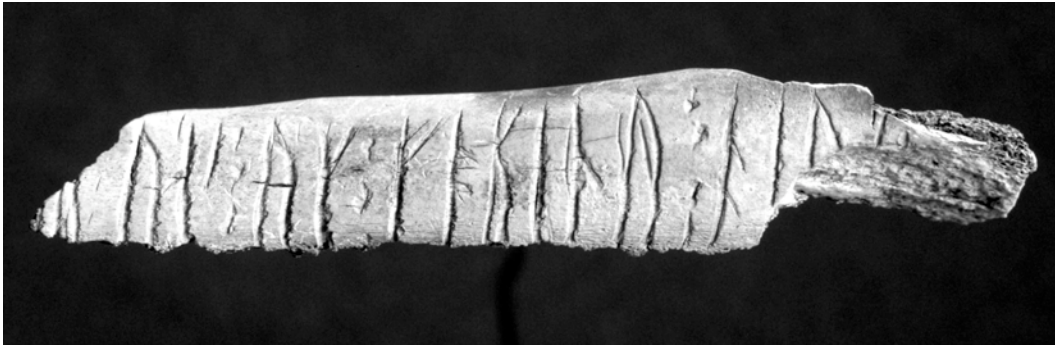
Fig. 1. Runben från Birkas garnison (Gustavson 2001, 2009).

ta funktioner och behov (Hedenstierna-Jonson 2006).