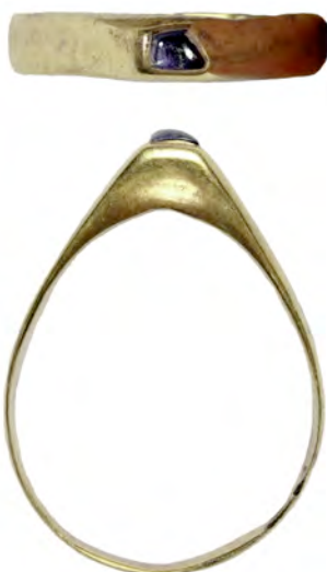
Fig. 5. Stigbygelring. Professorn 1 nr 807. Skala 2:1.