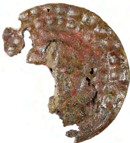
Fig. 3. Det äldsta daterade ottonska spännet i Sigtuna. Professorn 1 nr 14620. 1000-talets första fjärdedel. Skala 2:1.