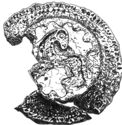
Fig. 2. Agnus Dei-spänne. Fjärrvärmegrävningen 1991-92, Fnr 19. Skala 2:1. Ritning Jacques Vincent.