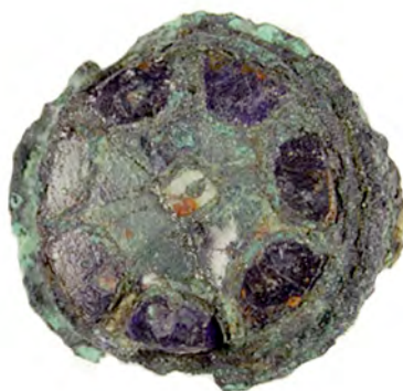
Fig. 7. Anglo-saxiskt spänne i cloissonnéteknik. Trädgårdsmästaren 9-10 nr 13863. Skala 2:1.