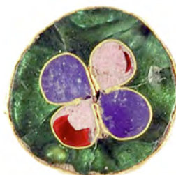
Fig. 4. Emaljdetalj i cloissonnéteknik. Bysantinskt eller italienskt arbete. Trädgårdsmästaren 9-10 nr 3035. Skala 4:1.