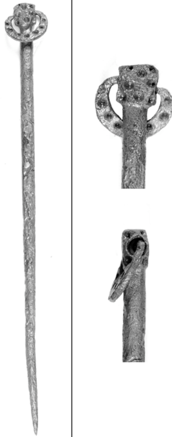
Fig. 8. Irisk dräknål. Trädgårdsmästaren 9–10 nr 3934. Skala 1:1.

1000-talet vilket stärktes med Knut den stores nordsjövälde under århundrades första hälft (Pedersen 2004). Dateringarna för de danska spännena omfattar just sent 900-tal och hela 1000-talet, vilket stämmer med observationer i produktionslandet England. Spännets från Sigtuna ligger i kontexter från första halvan av 1200-talet, vilket tillsammans med det slitna och korroderade skick-