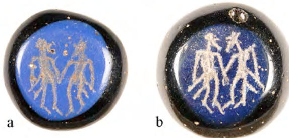
Fig. 6. Alsengemmer. a) Professorn 1 nr 4168, b) Professorn 1 nr 4334. Skala 2:1.