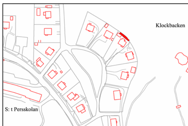
Figur 2 Schaktplan över den undersökta ytan i kvarteret Tunet 7 (markerat med rött).

Inga fornlämningar påträffades inom exploateringsområdet.