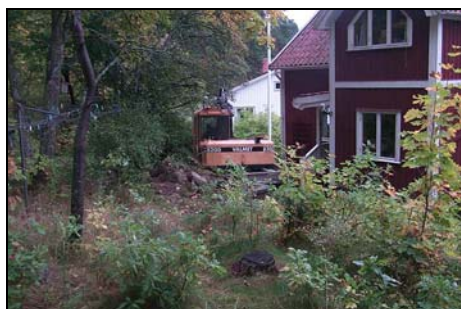
Figur 1 Schaktningsarbete bakom fastigheten i kvarteret Tunet 7. Bilden är tagen från norr.

Kvarteret Tunet är beläget nordväst om det medeltida stadsområdet på den nordvästra sluttningen upp mot Klockbacken. Exploateringsområdet präglas av blockrik morän med bergsklackar ovan mark.