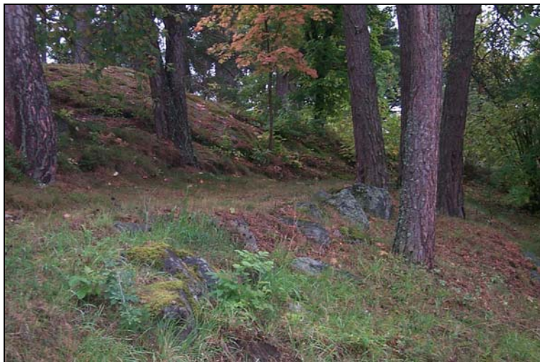
Figur 4 Bilden visar den södra terrasseringen.