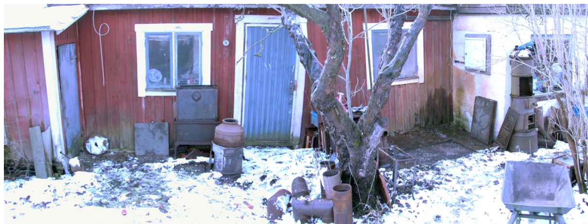
Figur 3, lägesbild för de två schakten, foto från norr.

Utifrån dessa iakttagelser kan på goda grunder antas att här finns 80-100 cm djupa orörda kulturlager från tiden sent 1100-tal – tidigt 1200-tal från en miljö med tät trähusbebyggelse med direkt närhet till strandlinjen under andra halvan av 1100-talet.