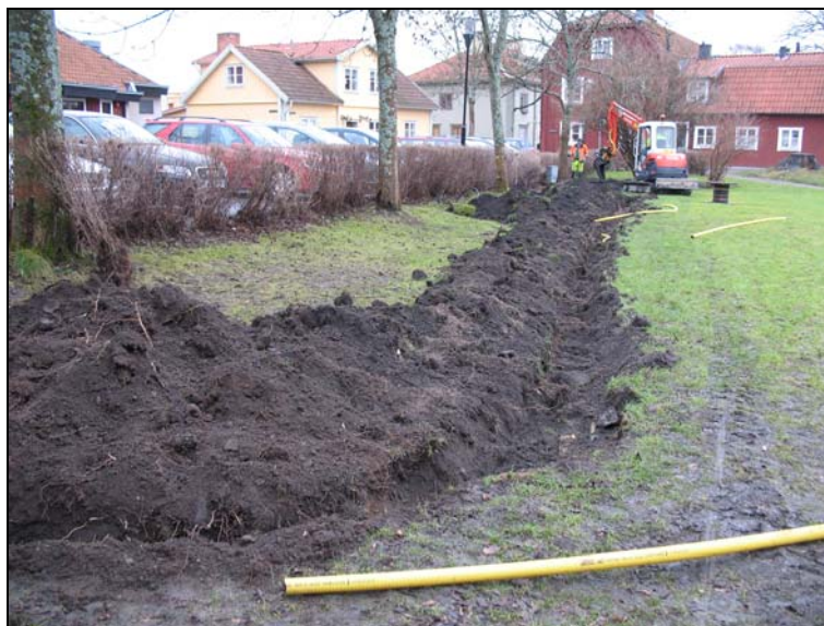
Fotografiet visar schaktets placering i kvarteret Trekanten. Bilden är tagen från öster.