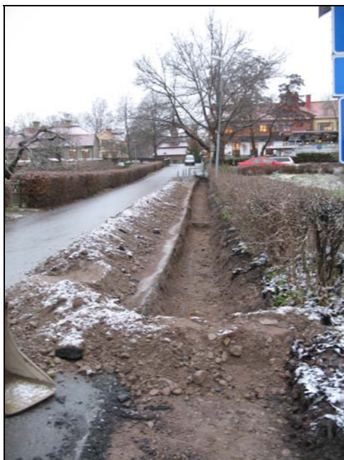
Schaktet vid Torggränd. Bilden är tagen från söder.