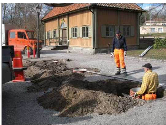
Fotografierna visar schaktens placering på Stora Torget. Den vänstra bilden är tagen från väster och den högra bilden från öster.