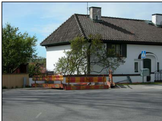
Schakt 1 fr. norr