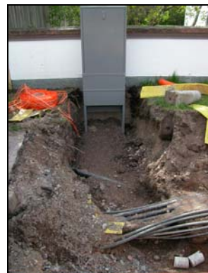
Schakt 1 fr. norr