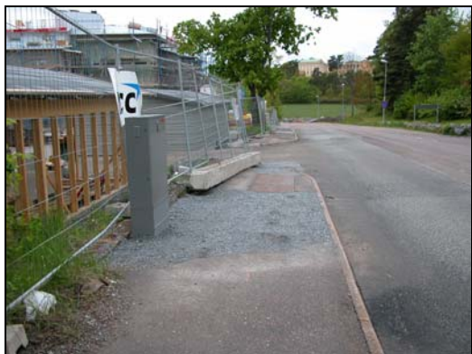
Schakt 2 fr. öster