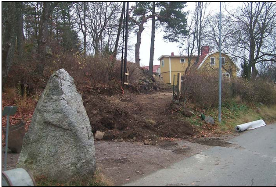
Figur 1 Den del av området som banades av inför anläggandet av en temporär grusväg upp mot fastigheten (det gula huset). I förgrunden runsten U 393.

Kvarteret S: t Nicolaus är beläget norr om det medeltida stadsområdet på den sydvästra sluttningen upp mot Klockbacken. Exploateringsområdet präglas av blockrik moränterräng med bergsklackar ovan mark.