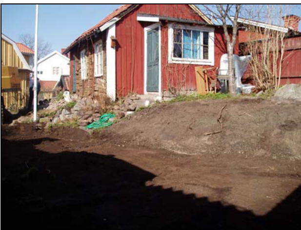
Figur 2 Fotografi över schaktet i kvarteret Smeden 2 från sydöst. Till höger i bild syns kullen som utgör den ursprungliga markytan.

Inga medeltida kulturlager eller konstruktioner påträffades. Däremot påträffades i trädgården tre tillhuggna stenar som sannolikt har tillhört någon eller några av Sigtunas medeltida kyrkor. En av stenarna var rund, ca 0,4 meter i diameter, och har troligtvis utgjort delar av en pelare (figur 3). Dessa stenar finns fortfarande kvar på plats.