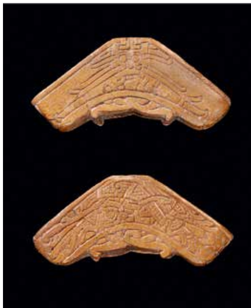
Figur 1a & b. Svärdshjalt av älghorn, Sigtuna, kvarteret Handelsmannen, fynd nr SF 1965. Bredd 101 mm.