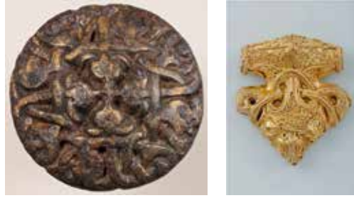
Figur 11 t.h. Guldhänge av Hiddenseetyp från kvarteret Tryckaren. SHM 27883:1. Bredd 22 mm.

Mammenstil (Jansson 1991:279) (fig. 10). Liknande patriser har påträffats på platser som Lund, Viborg och Hedeby. I ringvallsborgen i Borgeby i Skåne har dessutom framkommit en gjutform till en sådan patris (Svanberg & Söderberg 1999). Bland de exklusiva fynd från Sigtuna som tillhör samma konstnärliga krets som patrisen, kan även nämnas det kända guldhänget av Hiddenseetyp, även det påträffat i kvarteret Tryckaren (Tesch 2007b:96, c: 237f) (fig. 11). Guldhängets närmaste parallell är ett fynd från Fyrkat, en av de danska kungliga ringvallsborgarna (Duczko 1995:648). Sigtunafyndens koppling till en dansk kunglig miljö är således uppenbar. Dessa och andra fynd i Sigtuna pekar på att det under stadens äldsta skede funnits inte bara en utan flera kungliga verkstäder i de centrala kvarteren Tryckaren, Humlegården och Urmakaren, som bl. a. sysslade med avancerat guldsmede, myntslagning, vikt- och smycketillverkning och sniderier i horn och valrosselfenben (Tesch 2007c, om staden som scen se Tesch 2015). Anders Söderberg har beskrivit det som ett decentraliserat "landscape of royal workshops" som omgärdade den förmodade kungsgården i kvarteret S:ta Gertrud (2011b:17). Ingmar Jansson har visat på förekomsten av avancerat danskt guldsmede i Sigtuna även hundra år senare "... , en fortsättning på de danska konstnärskontakter som vi anar under Sigtunas äldsta tid" (2010:33).