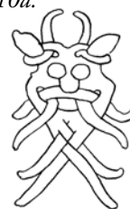
Figur 7 t.h. Maskbild på Åhusstenen 3 DR 66. Runinskriften på stenen lyder: "Gunulu och Ögot och Aslak och Rolf reste denna sten efter deras kamrat Ful. Han fann döden ... då kungar kämpade". Efter Floderus 1946.

Camminskrinet är tillverkat av ek och klätt med utskurna och rikt ornamenterade hornplattor inramade med förgyllda bronsband. De flesta källor uppger att plattorna troligtvis är tillverkade av älghorn. Tyvärr verkar det inte ha gjorts någon osteologisk analys av hornplattorna innan skrinet försvann. Skrinets dimensioner är 69 x 33 x 26 cm och formen påminner om en kungahall som står på sex fötter. Bambergskrinet är även det gjort av ek. Det har en kvadratisk grundplan med raka sidor och ett välvt lock. Skrinets dimensioner är 26 x 26 x 13 cm. De ornamenterade plattorna är tillverkade av valrosselfenben (Muhl 1990:299ff). 5 I båda skrinens bildprogram ingår alla Mammenstilens karakteristiska motiv: fåglar, masker, växtrankor och fyrfotadjur. Till denna skara av "Objet d'Art" i Mammenstil, ingående i katedralskatter på skilda håll i Europa, hör även S:t Stefanssvärdet i S:t Vituskatedralen i Prag ( fig. 6 ) och en cylindrisk liten relikvariebox i S:t Isodorokatedralen i Leon i norra Spanien, båda tillverkade av valrosselfenben (Jansson 1991:280; Roesdahl 1998, 2010a och b). Såväl S:t Stefanssvärdet som cylinderboxen är föremål som ursprungligen kan ha haft en profan funktion, som kröningssvärd respektive saltbehållare (Tesch 2007a:266).