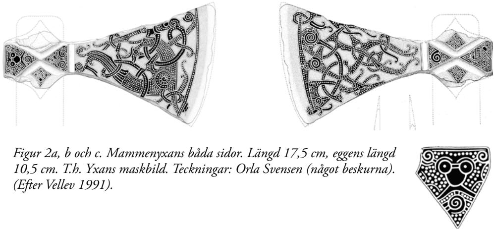
Figur 2a, b och c. Mammenyxans båda sidor. Längd 17,5 cm, eggens längd 10,5 cm. T.h. Yxans maskbild. Teckningar: Orla Svensen (något beskurna). (Efter Vellev 1991).