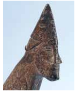
Figur 13. "Sigtunavikingen", av älghorn. Påträffad i kvarteret Trädgårdsmästaren 1937. Okänd funktion. Hel längd 22,4 cm, huvudets längd 4 cm. SHM 22044.

detta inte är en bild av en råbarkad viking utan att det snarare handlar om ett härskarporträtt (fig. 13) av samma slag som vi möter på såväl Anund Jakobs som Knut den Stores mynt. Vanligtvis har föremålet daterats till den sena vikingatiden. Med utgångspunkt från hårmodet och stilen har även en datering till ca 1100 föreslagits (O'Meadhra 2010:92). Oavsett om föremålet är samtida med Sigtunahjaltet eller inte, så är det ändå fullt rimligt att tänka sig att den person som en gång paraderade med svärdet på Stora gatan i Sigtuna uppträdde med en lika nobel och självsäker framtoning som "Sigtunavikingen".