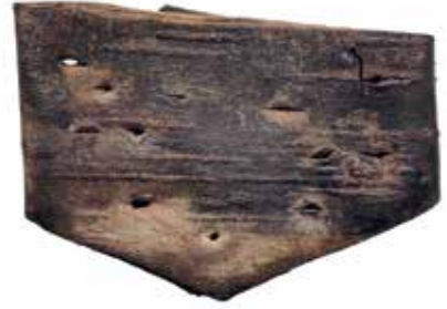
Figur 2. "Näverpaket" från undersökningen i kv. Professorn 1, Sigtuna, 1999-2000. Fyndnummer 10755. Bredd 64 mm. Daterat till ca 1050.