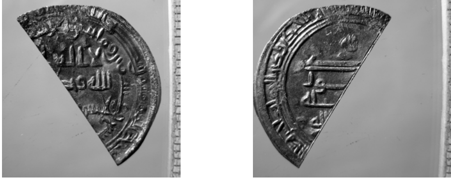
Fig. 4. Kalif al-Wathiq. Fragment av abbasidisk dirham 843/44. Yngsta läsbara mynt i Sundveda. 0,91 g. Skala 2:1.

mynt från Kalifatet. Sundveda, med ett tpq 2 på 843/44, kan sägas tillhöra våg nr 2. Fram till 820 kan andelen nordafrikanska mynt i de ryska fynden utgöra 50 %, för att sedan sjunka. Detta har sin bakgrund i den islamiska provinsen Africa, dagens Tunisien. Africa hade med sina två myntorter, Ifrîqiya och al-'Abbâsiyya, en tidvis viktig roll i Kalifatets ekonomiska politik. Under ett femtontal år, medan Hârûn al-Rashîd (170–193 / 786–809) var kalif i Bagdad, tröt produktionen av silvermynt där. Då fick de nordafrikanska myntorterna tråda in som ersättare, vilket ledde till att nordafrikanska dirhemer cirkulerade i hela Kalifatet och följaktligen även i Ryssland–Skandinavien. Till saken hör att de afrikanska mynten är av sämre kvalitet. De har lägre vikt och håller lägre silverhalt, förutom att mynten var lätt igenkännbara på sina mindre eleganta inskrifter. Ändå gällde de som mynt i Kalifatet på samma villkor som alla andra. Tidiga fynd i Mellanöstern har samma höga andel afrikanskt som Ryssland. För övrigt innehåller Väsbyfyndet endast 3 % afrikanskt. Den första grupp som frigjorde sig från Kalifatet var de shiitiska idrisiderna i Marocko. Idriidmynt finns i Sundvedafyndet, liksom en