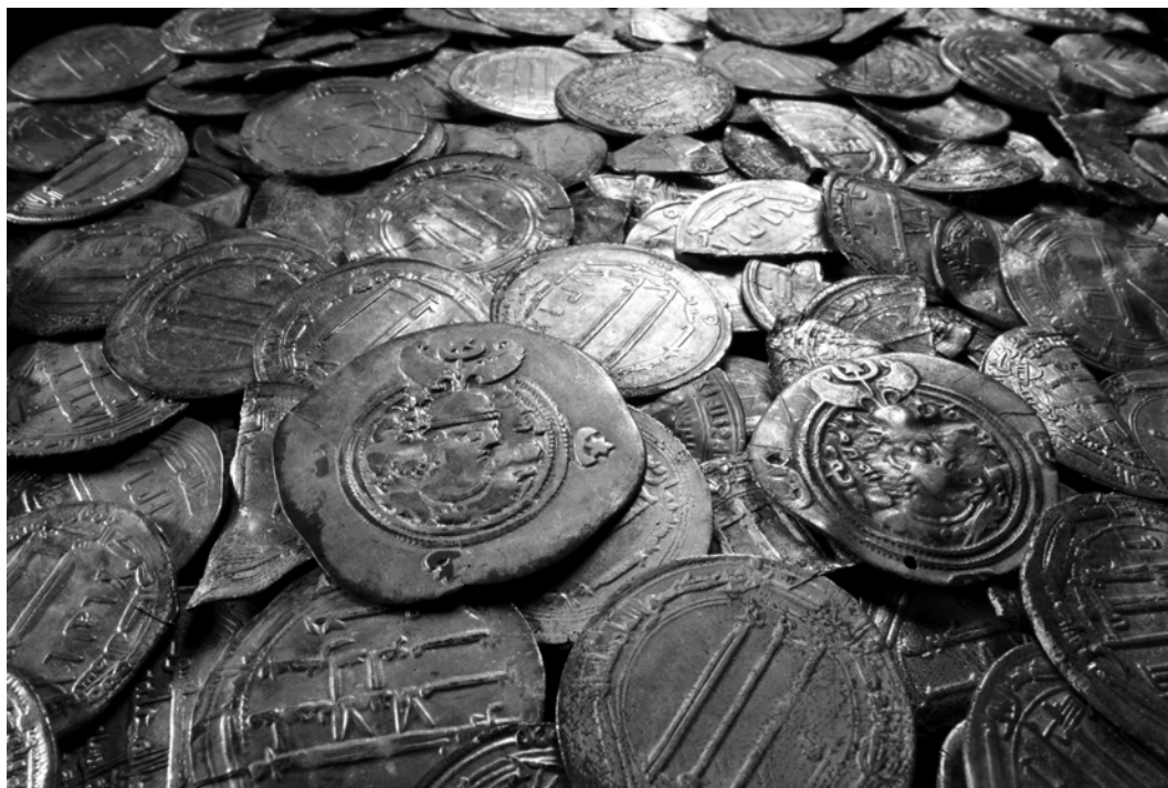
Fig. 1. Mynt ur Sundvedaskatten efter konservering.

men åtskilliga är mycket mindre än så. Det brukar framhållas att fynd från svenska fastlandet är mer fragmentariska än gotländska fynd. Sundvedafyndet följer detta mönster, men även Gotland har gott om fragmentariska mynt, och fastlandet gott om hela mynt. Graden av fragmentering borde ställas mot tid (800- eller 900-talsfynd) och myntens ursprung, men existerande statistik tillåter f.n. inte vidare slutsatser, mer än att fragmenteringen allvarligt försvårat eller omöjliggjort precisare bestämningar.