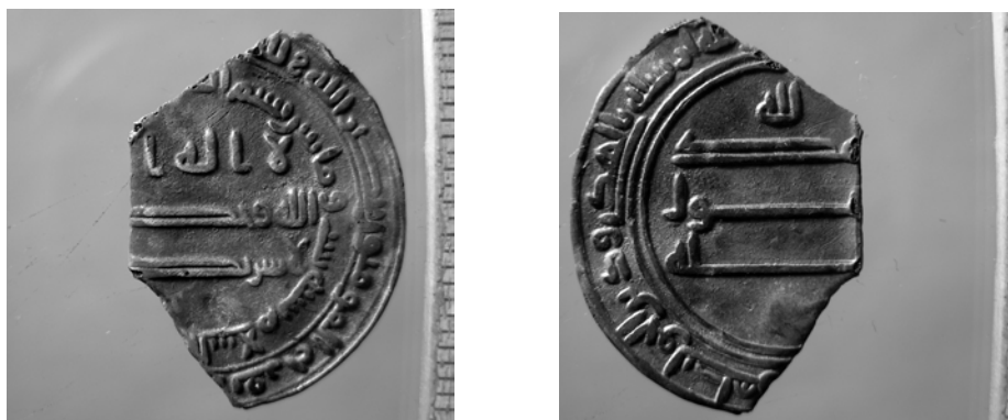
Fig. 3. Kalif al-Ma'mun. Fragment av abbasidisk dirham 822 med den nya epigrafiska stilen i Bagdad. Första kända ex. i Skandinavien. Sundveda, 1,80 g. Skala 2:1.

Alla pahlavimynt i Sundvedafyndet kommer från det nutida Irans område.