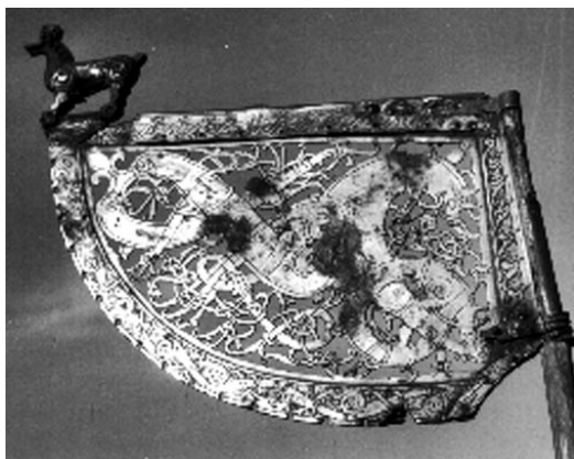
Fig. 1. Söderalaflojeln är utförd i Ringerikestil i förgylld brons. Att den prytt ett vikingatida krigskepp är troligt. Ornamentiken påminner om den som målade beskrivits av ett ögonvittne till Sven tveskäggs och Knut den stores anfall på England.

En utomstående iakttagare, en anonym flandrisk munk, har efterlämnat beskrivningar både av Sven tveskäggs flotta, som den såg ut när den samlades 1013 för att anfälla England, och av Knut den stores motsvarande örlogsstyrkor 1016 (Pertz 1865; Campbell 1949; jfr Crumlin-Pedersen 2002). Där heter det att stävarna var kopparbeslagna och försedda med gyllene lejonfigurer. I masttopparna satt bronsflöjlar, utformade med delfiner och kentaurer (fig. 1). Skeppssidorna var målade i bjärta färger. Munkens iakttagelse ” Erant autem ibi scutorum tanta genera, ut crederes adesse omnium populorum agmina ”, att så många olika slags sköldar var att skåda att man skulle ha trott att det var härskaror från alla slags folkslag som samlats, tycks också bekräfta vad som framgår av runstenskällorna (se nedan), nämligen att den av danska kungar kommenderade hären var sammansatt av krigare från hela Skandinavien, ledda av egna hövdingar med egna skepp.