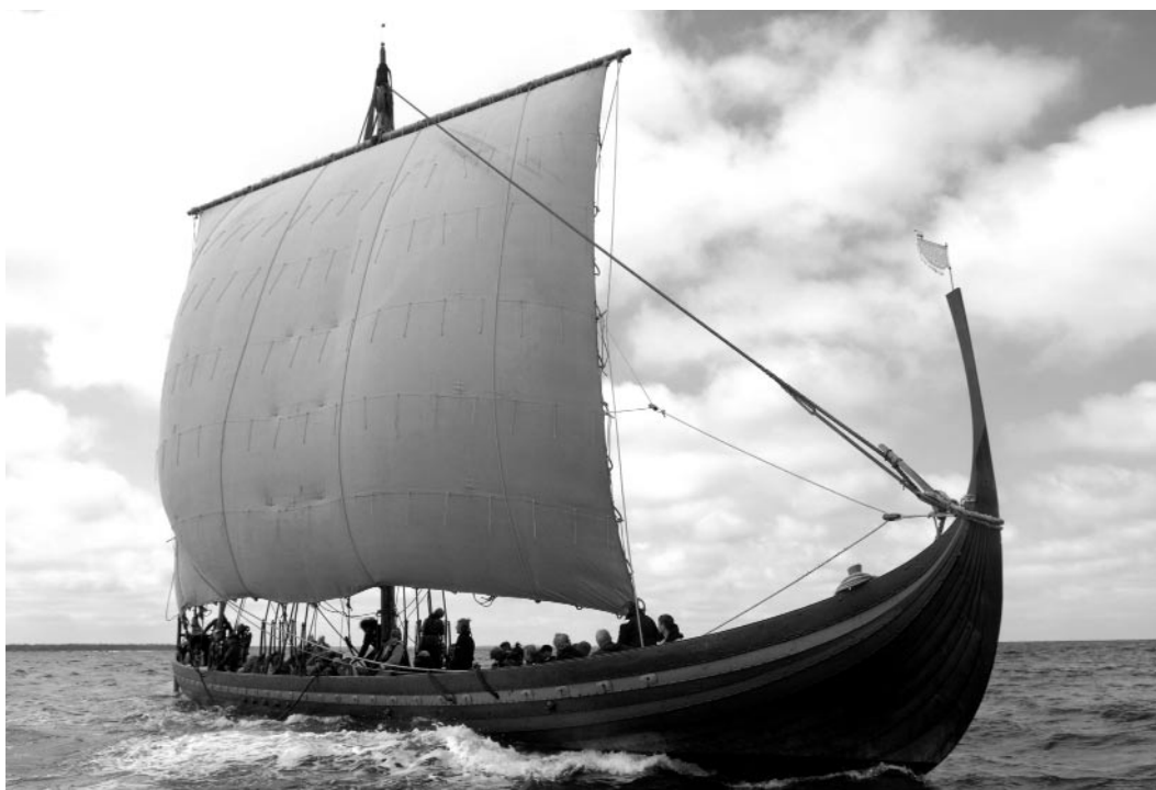
Fig. 2. Havhingsten från Glandalough, en kopia av det 29 meter långa krigsskeppet "Skuldelev 2". Foto Werner Karrasch, Vikingaskeppsmuseet i Roskilde (2004)

ler 900-tal: 43, 128, 138 och 153. Sex till 900-tal: 4, 15, 184, 189, 190 och 295 (Imer 2004; jfr Varenus 1992:51f). På dessa 800- och 900-talsbilder ger skepp och besättning ett mycket krigiskt intryck. Männerna bär hjälmar, många har svärden redo och i aktern sticker spjut upp, färdiga att gripas vid en landstigning. Antalet synliga ombordvarande varierar mellan 6 och 13. Att avgöra hur stora skeppen varit i förhållande till detta är problematiskt. På bildsten nr 295 (Nylén & Lamm 1987) ses t. ex. elva man ombord. På den sida som vetter åt betraktaren hänger samtidigt 15 sköldar. Rimligen finns sköldar också på motsatt sida av skeppet. Man skulle därför kunna anta att det finns 30 man ombord. Antalet sköldar kan då alltså möjligen och i förekommande fall vara en bättre indikator än antalet män på skeppets storlek.