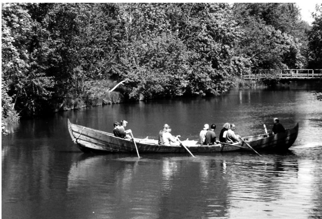
Fig. 3. Freja, en kopia i furu av den 9,5 m långa båten från Vik, Söderby-Karl.