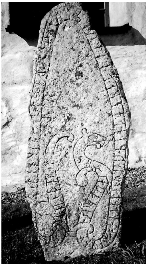
Fig. 5. Ulf i Borrestas dödssten (U344), nu vid Orkesta kyrka.

Den bevarade skaldediktningen och sagalitteraturen ger ett västnordiskt perspektiv på tidens händelser och uppgifterna om svenska förhållanden är relativt sparsamma. Detta förhållande, i kombination med uppmärksamheten kring svenska äventyr i österled, kan skymma det faktum att svenskar deltog inte bara vid Svolder utan också med liv och lust i de massiva vikingahärjningarna västerut under perioden 900-talets slut till 1000-talets början. Enligt Adam av Bremens tillspetsade och diskutabla version