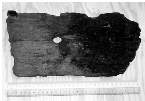
Fig. 6. Bordläggningsplankor med kvarsittande båtbit (uppe till vänster). Linjalen är 30 cm. Fynd från Professorn 1, Sigtuna. Foto förf. (2005).

• Föreställningarna om äldre, genomgående båtleder i Uppland, liksom idéer om en vikingatida kunglig örlogsledning, får ses som en blandning av rudbeckianska tankar och omotiverad projicering bakåt av föreskrifter i medeltida lagar. ”Leder” har för övrigt också som ett modernt trafik- och turistbegrepp smittat av sig på föreställningar om äldre tiders förhållanden. Först i och med tillkomsten av icke-agrara befolk-