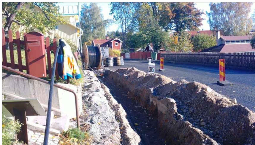
Fotografiet visar schaktet söder om Klockbacken. Bilden är tagen från väster.