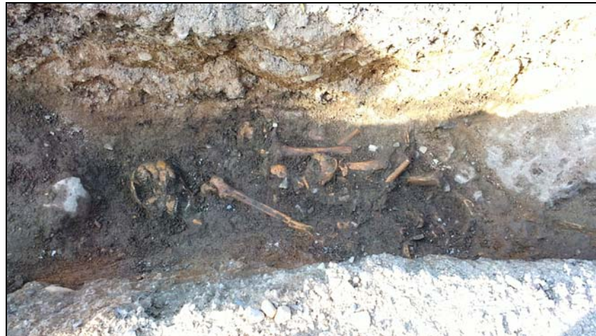
Fotografiet visar en grav som påträffades strax söder om S:t Lars kyrkoruin. Bilden är tagen från söder.