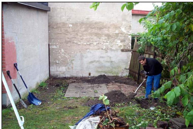
Schaktningsarbete för hand i kvarteret Ödåker 7