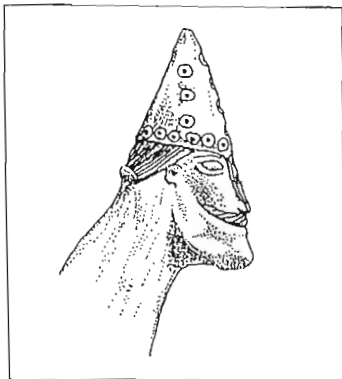
Sigtunautgrävningens symbol- den välkände vikingen från Sigtuna.

För oss som har medverkat till att föra utgrävningen i hamn har det varit en mycket spännande och omtumlande tid. Utgrävningsarbetet har också följts av en stor och intresserad allmänhet - sigtunabor och hitresta, forskare från hela världen och massmedia av olika slag - från Norrskensflaman till Kyrkans tidning, från Vetandets värld till Dagens eko och från Go´morrn Sverige till Aktuellt. Kungen och drottningen, Nordens statsministrar, kulturministern och ärkebiskopen tillhör de mest prominenta gästerna som satt sina fotavtryck i de tusenåriga kulturlagren.