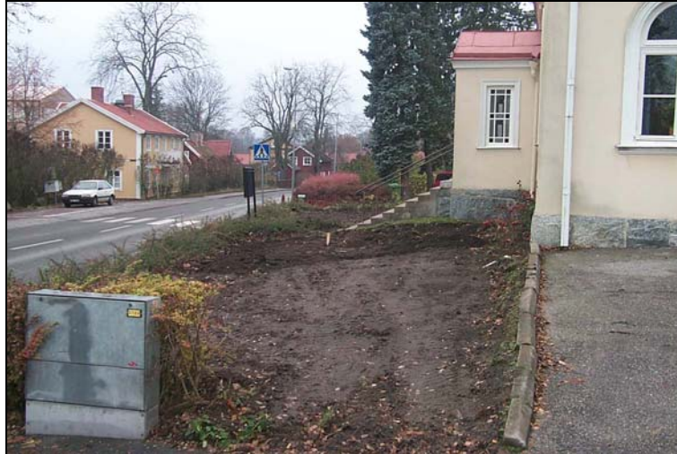
Figur 2 Den avbanade ytan framför Salemskapellet. Bilden tagen från öster.

Eftersom det varken vid avbaningen eller vid undersökningen av provgroparna grävdes ned till morän gick det inte att helt avfärda möjligheten till att det finns gravar inom exploateringsområdet. Därför bestämdes att en arkeolog skall närvara vid det fortsatta arbetet med tillbyggnaden, som beräknas fortsätta våren 2004.