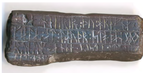
Runbrynet från kvarteret Humlegården är en modern fejk.