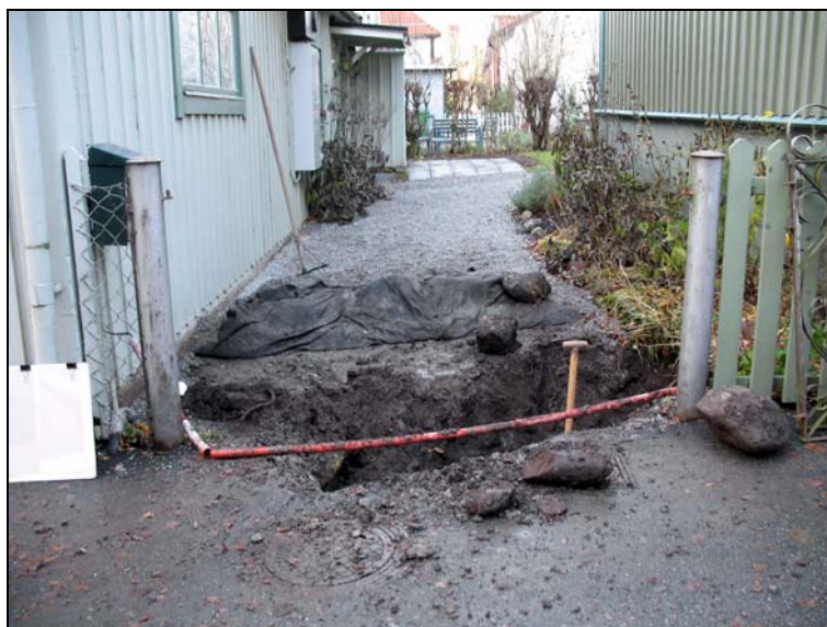
Fotografiet visar schaktets placering intill Laurentii gränd. I förgrunden syns en framtagen mycket väl bevarad trästock.