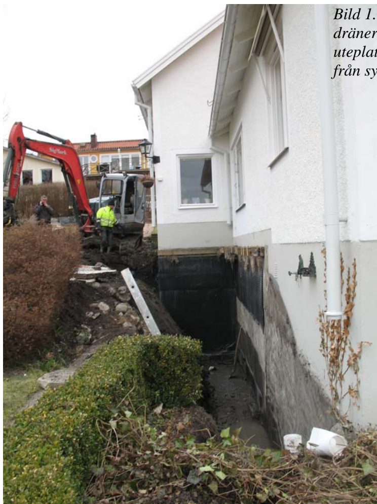
Bild 1. Fotografi från arbetet med dräneringsschakt samt schaktning för uteplats i kv. Kammakaren 5. Bilden tagen från sydost.