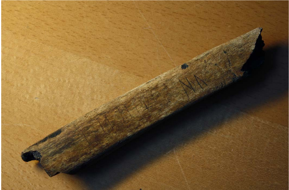
Bild 4. Fotografi av runben SI 115, fyndnr. 6.