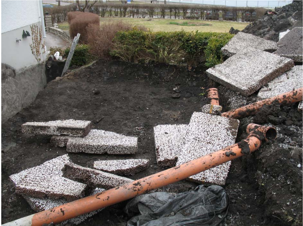
Bild 2. Fotografi av schaktad yta för uteplats i kv. Kammakaren 5. Dräneringsschakt synligt till vänster i bild. Bilden tagen från nordväst.