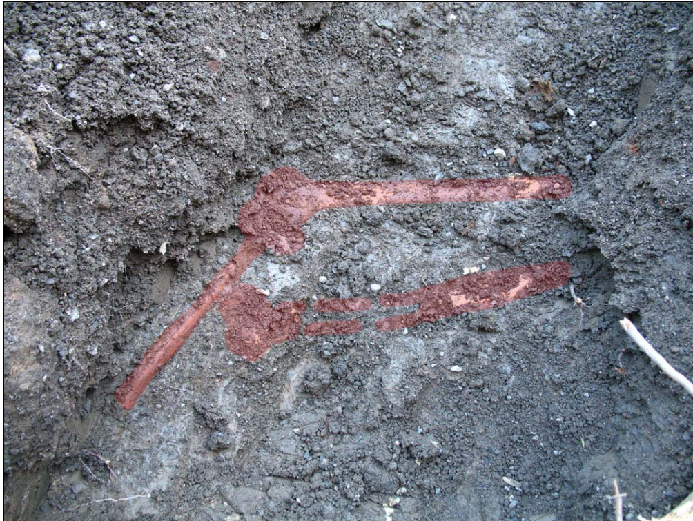
Fotografi över den påträffade graven med skelettdelarna markerade med rött. De delar som kom fram var lårbenen (höger något skadad av grävmaskinen) samt höger underarm och hand. Armens ställning tyder på armställning B.