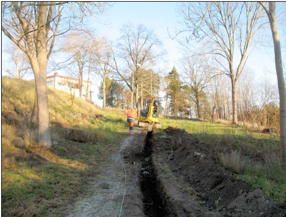
Schaktets placering med Hotell Kristina i bakgrunden till vänster. Bilden är tagen från väster.