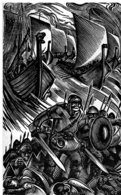
Fig. 1. Illustration av E. Järv i A. Mälks roman "Läänemere isandad" (Östersjöns härskare).