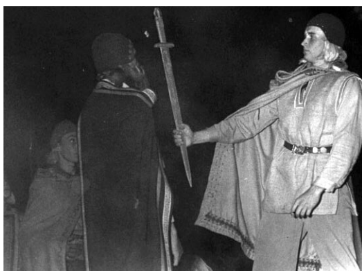
Fig. 2–3. Esterna erövar Sigtuna 1187. Från de estniska scouternas lägerspel Alar Atapoeg vid Drevviken 1952.