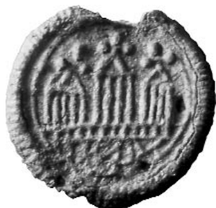
Fig. 3a. Vid Sigtunautgrävningen 1988–90 påträffades ett litet runt föremål, möjligtvis ett hänge, med en framställning med tre kyrkor på båda sidorna.