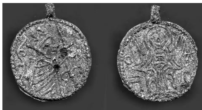
Fig. 4. Vid den stora utgrävningen i kv. Professorn 1 1999–2000 påträffades två identiska, gjutna hängen. Diameter 2,45 cm. Materialet är en tenn/blylegering. På den ena sidan höjer en kung, med kronan käckt på svaj, sitt svärd. I kompositionen ingår också en spira. På hängets motstående sida möter vi en helig figur, troligtvis Kristus eller Maria Guds moder, sittande på en tron och med armarna höjda i en s.k. adorantställning. En symbol för eller en souvenir från Kungens och Guds Sigtuna? Datering: 1100-talets mitt.

Två olika framställningar av samma motiv tyder på att detta var ett välkänt motiv i Sigtuna, som kanske också symboliserade staden. Motivet är inte olikt flera städers senare stadsvapen. Sigtuna Museum har på senare tid anammat motivet som sin logotyp.