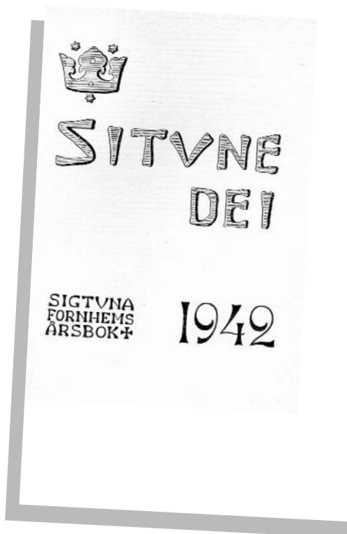
Fig. 1. Omslaget på Situne Dei 1942.

den bedrevs i hög grad av tjänstemän från Stockholm (Raä/SHM). Erik Floderus (1902–1955) var en av de flitigaste, både som utgrävare, forskare och artikelförfattare. År 1941 utgav han boken "Sigtuna – Sveriges äldsta medeltidstad", som är en första och relativt populärt hållen syntes av vad Sigtunaforskningen då hade uppnått. Året därpå startade utgivningen av Situne Dei med Holger Arbman (1904–1968) som redaktör (fig. 1). Utgivningen pågick fram till dubbelhäftet 1951–1952. Några årgångar (1942, 1943 och 1947) kan fortfarande köpas i museets butik. Årsbokens slagkraftiga namn var hämtat från det kanske mest kända Sigtunamyntet av alla – ett Olof skötkonungsmynt från 1000-talets början med