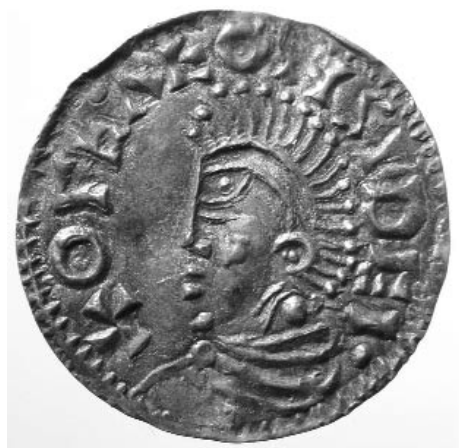
Fig. 2. SIDEI-myntet