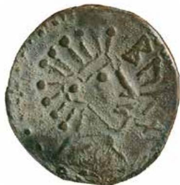
Det vikingatida BURN-myntet ur Sigtuna museums samlingar.