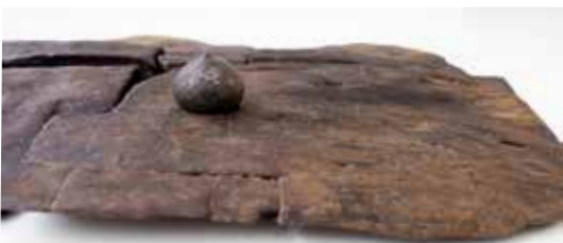
En del av ett Hnefatafl-spelbräde från 1000-talets Sigtuna.

Öppet tisdag-söndag 12.00–16.00. Fri entré.