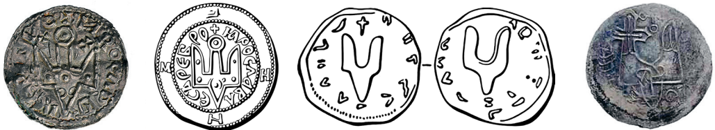
Figur 5 längst till vänster. Frånsidan av ett mynt slaget för storfurst Jaroslav I. Myntet kan vara slaget i Novgorod 1018 (Lindberger 2001:79). Rurikidsymbolen, tridenten, har ögon och liknar en dykande rovfågel.

En släktskap har härletts till de dykande rovfåglar som bland annat återfinns på vikingatida nyckelskaft, spännen och doppskor till svärd från Östersjöområdet (Ambrosiani 2001; Lindberger 2001) (fig. 3 & 4), medan den å andra håll hellre härleds till khazariska klan- och ledarsymboler (Edberg 2001, Roslund 2023:174) Ursprunget är således inte självklart, om ens entydigt, flera olika äldre traditioner kan givetvis också ha vävts samman (Hedenstierna-Jonson 2009:170ff). Värt att beakta i detta