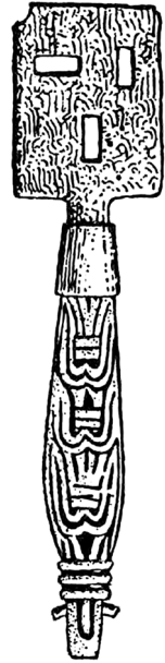
Figur 4 till höger. En nyckel funnen vid utgrävning vid Birkas garnison, här vänd upp och ned för att förtydliga de dykande rovfågarna på skaftet. Efter Arbman 1943:182.

En släktskap har härletts till de dykande rovfåglar som bland annat återfinns på vikingatida nyckelskaft, spännen och doppskor till svärd från Östersjöområdet (Ambrosiani 2001; Lindberger 2001) (fig. 3 & 4), medan den å andra håll hellre härleds till khazariska klan- och ledarsymboler (Edberg 2001, Roslund 2023:174) Ursprunget är således inte självklart, om ens entydigt, flera olika äldre traditioner kan givetvis också ha vävts samman (Hedenstierna-Jonson 2009:170ff). Värt att beakta i detta