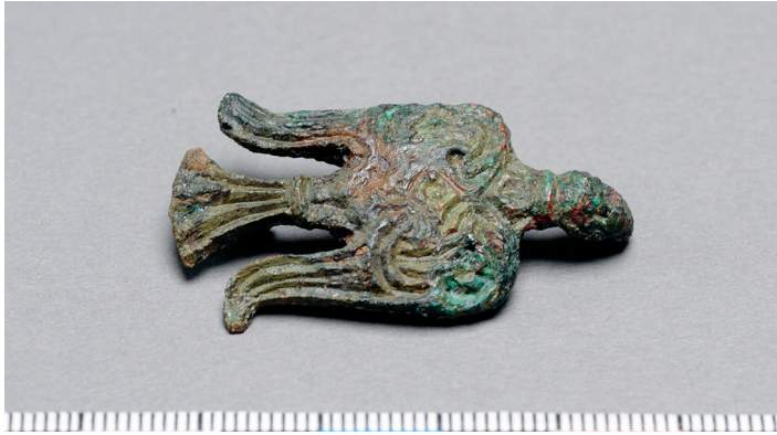
Figur 3 ovan. Fågelspänne av kopparlegering från utgrävning i Svarta jorden, Birka, 1992.