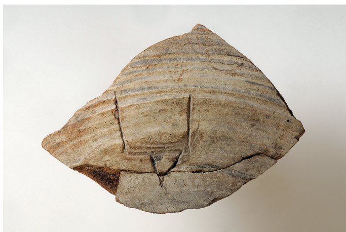
Figur 2. Amforafragmentet med rurikidsymbolen från utgrävningen i kvarteret Professorn 1 1999–2000, fynd nr 42634.

Av alla våra amforafragment tilldrar sig ett fragment från en amforas skuldra särskilt intresse då det har en symbol inristad på sig – en rurikidsymbol ( fig. 2 ). Rurikiderna var storfurst Jaroslavs ätt och de räknade sig som ättlingar till den svealändske stormannen Rurik, som enligt den östslaviska Nestorskrönikan skall ha grundat Kievriket år 862 tillsammans med sina bröder Signjot och Torvard (Oxenstierna 1998). Krönikan anses vara skriven av munken Nestor vid Grottklostret i Kiev kring år 1113.