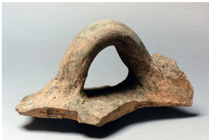
Figur 1. Ett handtag och en del av mynningen till en amfora, fragment funnet vid utgrävning i kvarteret Professorn 4 1996, fynd nr 5267.