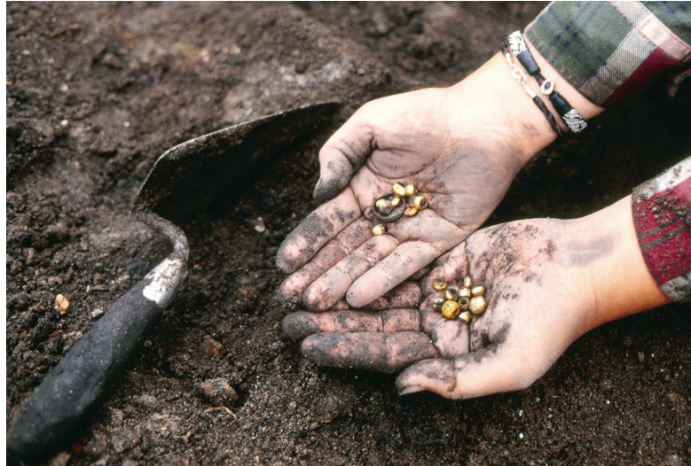
Figur 2. Fynd av guldfoliepärlor och en ring från kvarteret Professorn 2.

Gleb (d. 1016). Hypotetiskt har sigillen tillhört ett kungligt arkiv (Edberg 1995, 1996, 1997, 1999, 2022c).