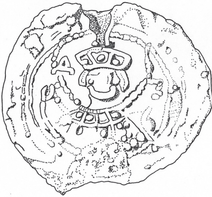
Figur 4. Davidssigillet åtsida. De kyrilliska bokstäver som motsvarar d och a , i den form som brukades vid tiden, är tydliga. Tolkan­de teckning: Johan Westerlund.