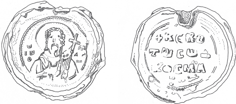
Figur 7. Kosmassigilletts båda sidor. Tolkande teckningar: Johan Westerlund.