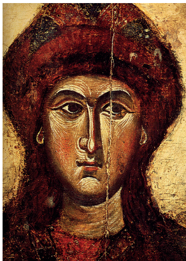
Figur 6. Sankt Gleb. Detalj från en ikon från 1300-talets början. Nu i Kievs konstmuseum. (Public Domain)

som några år senare äktade Olof Skötkonungs dotter Ingegerd. Uppgörelsen mellan bröderna fortsatte i årtal och fick ett slut först sedan Svjatopolk (för eftervärlden känd som ”den usle”) gått hädan och Jaroslav efter nya förvecklingar slutligt etablerat sig själv som storfurste i Kiev, ”alla ryska städers moder”.