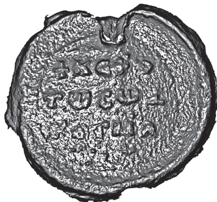
Figur 8. Kosmassilletts fränsida efter laserskanning och bildbearbetning 2022. Tidigare inte observerade punktmärken framträder nedanför textens tredje rad.

Det avbildade helgonet identifierades av de specialister, som uttalade sig inför publiceringen av sigillet 1999, som Johannes döparen, i Bysans ofta nämnd som Johannes Prodromos, det vill säga den Johannes som förebådade Jesus som Messias, i Bysans vördad som den främste profeten. Den grekiska texten på åtsidan nämner helgonets namn i förkortad form (Edberg 1999a).