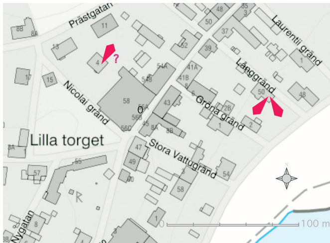
Figur 9. Fynden av påvebullen gjordes troligen vid ett husbygge vid Nicolai gränd (kv. Trädgårdsmästaren 6) 1941. De två övriga är från Sigtuna museums arkeologiska undersökning vid Långgränd (kv. Professorn 4), 1996.

På fransidan finns, omgivna av en pärlram, tre textrader. Präglingen är inte helt jämn, utan de två översta raderna är tydligare än den tredje. Det finns ytterligare plats under den tredje raden men vid undersökningen 1997 drog vi slutsatsen att utrymmet var tomt. Vid laserskanningen 2022 kunde vi emellertid se svaga punkter, men utan tydligt sammanhang, där (fig. 8).