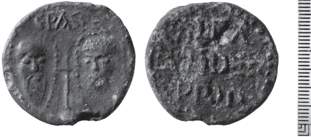
Figur 1. Påvebullans åtsida t.v. med texten SPE SPA och apostlarna Petrus och Paulus, symboler för påveämbetet. Frånsidan med texten Alexander PP III.