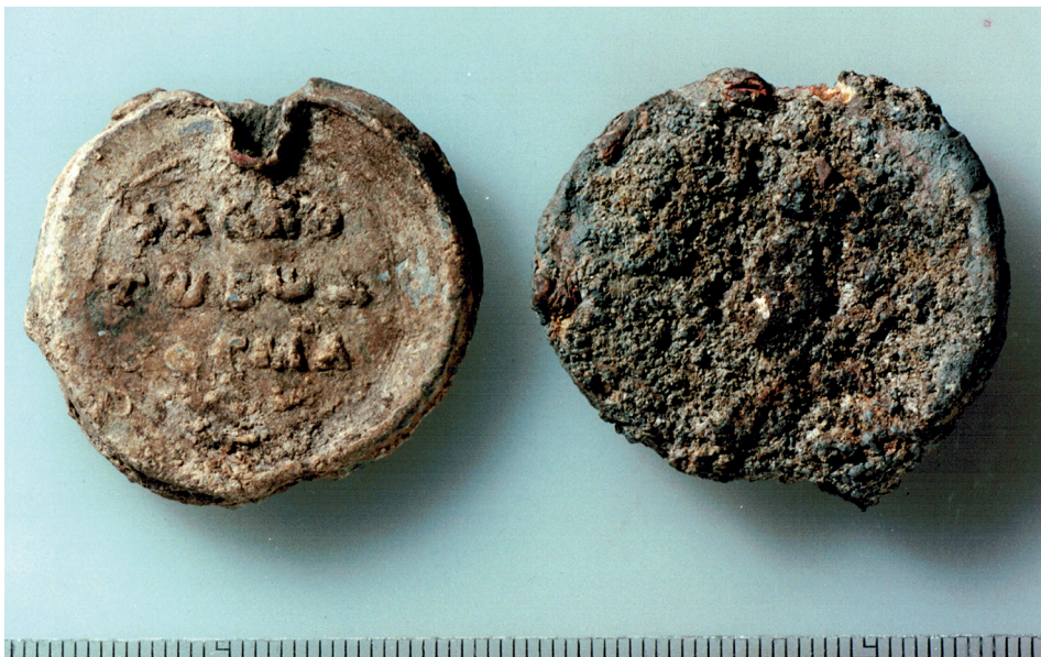
Figur 3. Frånsidorna på Kosmassigillet t.v. och Davidssigillet. Kosmassigillet text har i första hand tolkats som en grekisk bön: "Herre, hjälp din tjänare Kosmas". Davidssigillet är på denna sida genomkorroderat och helt oläsbart. Foto: Gabriel Hildebrand (före konservering).