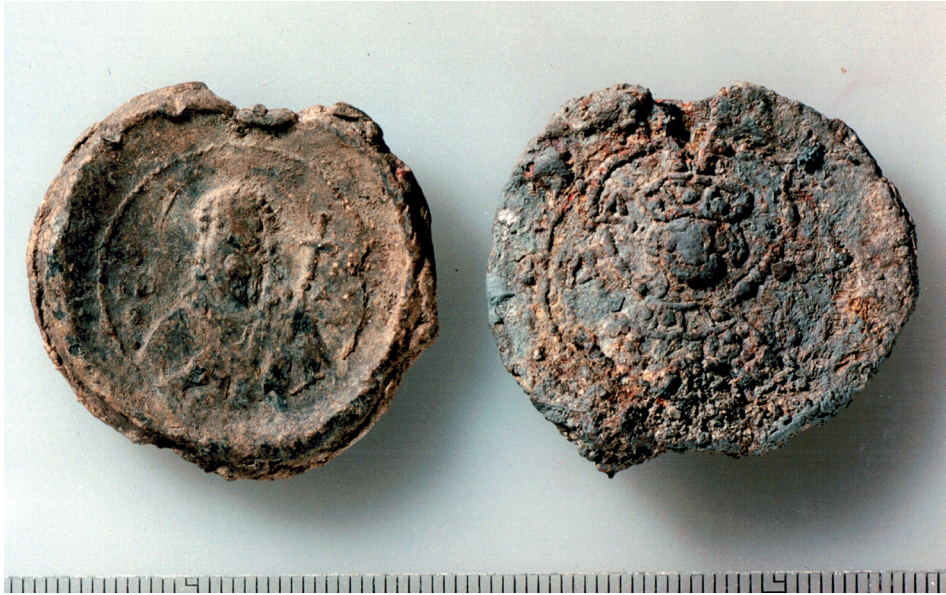
Figur 2. Åtsidorna på Kosmassigillet t.v. och Davidssigillet. Gestalten med processionskorset på Kosmassigillet har i första hand tolkats som Johannes döparen med sitt namn i grekisk gestalt (Ioannes Prodromos) angivet i förkortad form. Davidssigillet har ett kungaporträtt och kyrillisk inskrift: Da... (före konservering).