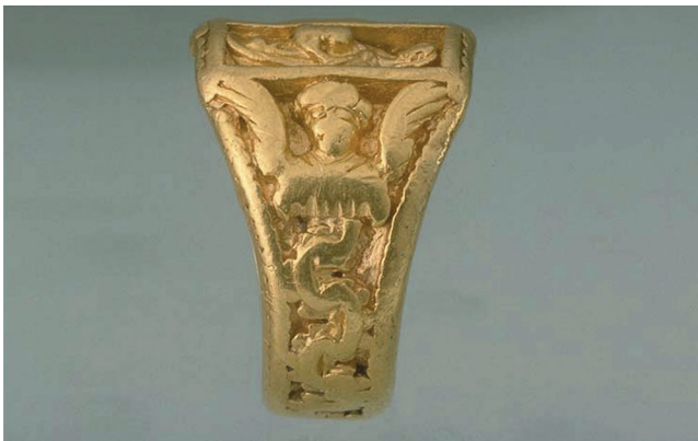
Figur 13. Ring med "Anna-självtredje" i Nordiska museets samlingar.