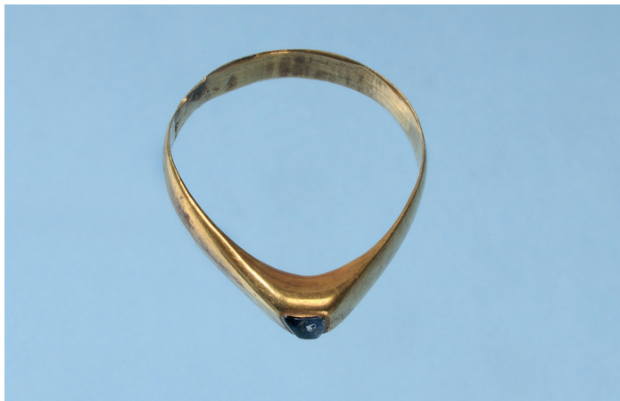
Figur 2 t.h. Ring med blå sten från kvarteret Professorn, Sigtuna.

En högmedeltida guldring av stigbygeltyp, ornerad med en liten, infattad blå sten som med stor sannolikhet är en safir hittades vid en utgrävning av kvarteret Professorn 1 ( fig. 2 ). Den här typen förekommer också i fyndmaterialet utomlands och har påträffats både i Tyskland och England, ibland i gravar med kyrklig kontext (Hirdman 2007: 102). De är vanligast under 1100- och 1200-talet, men de förekommer också under tidigt 1300-tal. Benämningen stigbygelring är missvisande och är troligen myntad på 1800-talet. Formen har egentligen inte så mycket med stigbyglar att göra utan kan istället kopplas till gotiken som stil. Ringens form bör snarare ses som en direkt inspiration från det nya, gotiska formspråket där ringens form imiterar ribborna i de nya ribbkryssvalven, introducerade omkring 1140 i klosterkyrkan St. Denis norr om Paris (Hirdman 2007: 104). Safiren ansågs ha magiska funktioner och kunde bland annat skydda dess ägare mot förgiftning och fungera som garant för sanning och trohet, men också användas i medicinskt syfte. Den ansågs till exempel kunna bota ögonsjukdomar och stärka intelligensen ifall man slickade på dem (Ferne, 1907: 97 ff. Shumann, 1976: 287. Bengtsson Melin 2014: 263). En 1200-talsring i brons som förlorat sin infattade sten hittades vid utgrävningen av kvarteret Trädgårdsmästaren vid grävningen 1988–90 (Wikström 2011).