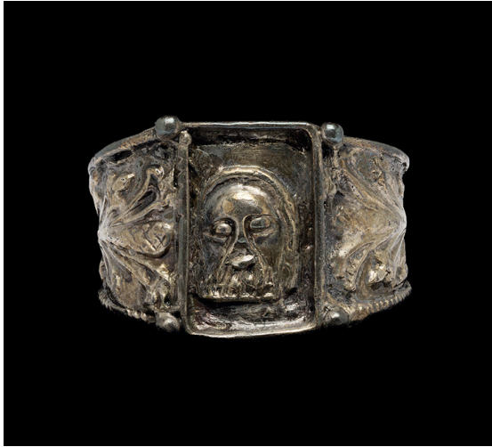
Figur 4. Svetteduksring från Gärdehem i Västergötland (SHM 6349).