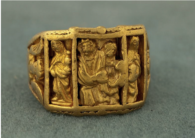
Figur 12. Skuldrorna på ringen ovan.