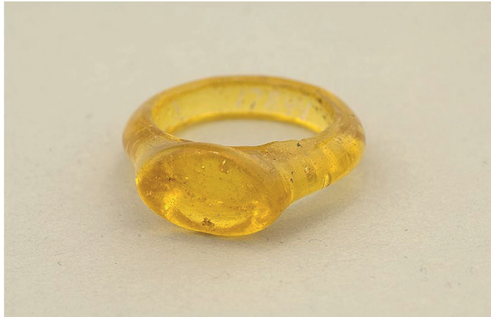
Figur 1 överst. Glasring med klack från Sigtuna i SHM (17844:695m).