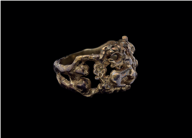
Figur 3. Ikonografisk ring med hjort (syftande på dopet) inskriven i en blomkrans och med Adam och Eva på skuldrorna (SHM 29359).

är förekommer. Framställningarna kan vara både representerande, där figuren bara skildras rakt upp och ner, eller narrativa, där figuren agerar i ett sammanhang, till exempel en helgonlegend eller en specifik händelse. Även ringar med symboliska motiv, som djur, kors och bladvors, räknas till gruppen ( fig. 3 ). Ibland förekommer inte någon regelrätt bildframställning, utan bara namn, monogram eller initialer syftande på heliga personer.