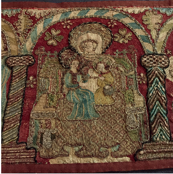
Figur 10. "Anna-själv-tredje" broderat på altarbrun från Vadstena klosterkyrka. Nu i Sancta Birgitta klostermuseum.

en "Anna-själv-tredje" broderad på ett altarbrun från 1400-talet som tillverkats i Vadstena kloster och som fortfarande förvaras där. Tolv scener, flera ur Annas och maken Joakims legend, skildras under arkadbågar. Scenen med "Anna-själv-tredje" visar Anna sittande på en tronliknande bänk med gotiskt ornerat ryggparti. På ena knät har hon den krönte Maria och mitt i Annas knä sitter Jesusbarnet med en korg i ena handen ( fig. 10 ).