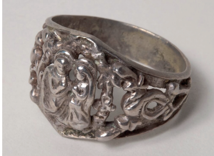
Figur 6. Ringen som låg vid fötterna av den begravda individen A 71.