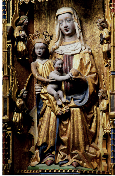
Figur 9. "Anna-självtredje" i altarskåpet i Lena kyrka i Uppland.

i föremålskatalogen tolkats som jungfru Maria med Jesusbarnet, något som vid en första blick verkar plausibelt. Tittar man lite närmare på ringen så uppkommer dock en del frågor. På Marias andra sida finns en skada som antyder att det kan ha funnits ytterligare en figur på tronstolen. Kan det rentav röra sig om ett annat motiv än madonnan med barnet? Ett motiv med tre figurer istället för två?