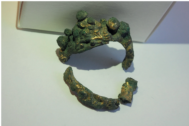
Figur 8. Ringen från Prästgatan är starkt anfränt och är i tre delar.