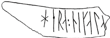
Figur 1. Runbenet med texten "Herr Niklas"; hera : nikala... Runtolkning: Helmer Gustavson.

Av platsens runtexter med anspelningar på prästerskap samt ett kristet träkors och en vaxtavla som man fört anteckningar på, anar vi närvaron av lärda personer som kan ha varit knutna till kyrkan. Kanske anar vi detsamma i fyndet av ett syllabarium, ett undervisningsredskap som använts vid inläring av runalfabetet.