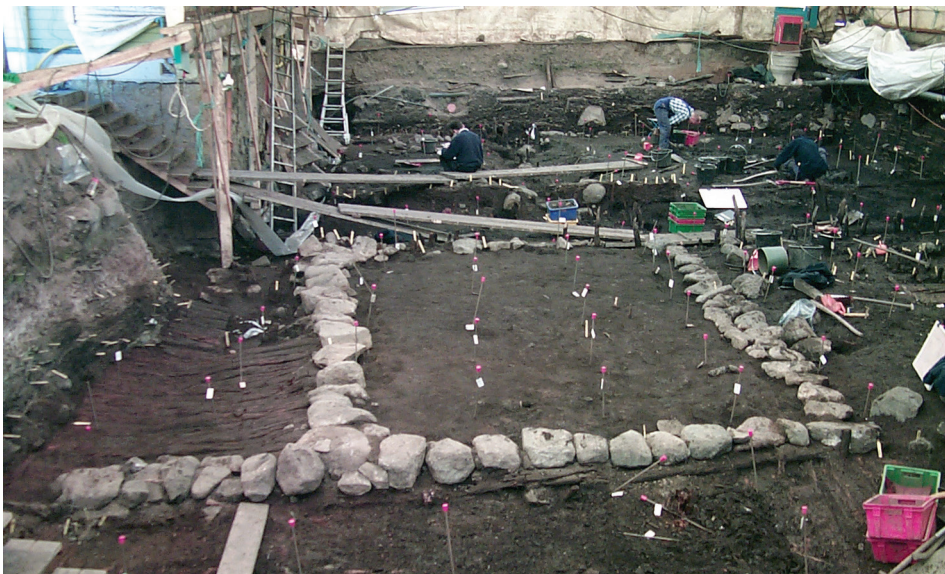
Figur 3. En del av utgrävningsschaktet med den bastanta syllstensgrunden till ett hus från 1000-talet.

Vi ser västeuropeiska anknytningar på platsen från och med 1000-talets första hälft. Under väggen till ett hus gömde någon en liten skatt med 156 silvermynt, de allra flesta tyska. Från det Tysk-Romerska kejsardömet kommer också fynd av förgyllda och emaljerade spännen.